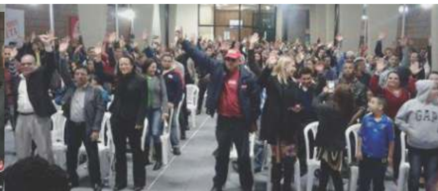
Confira um estudo sobre as Campanhas Salariais do Secor, de 2006 a 2015, na página 3!