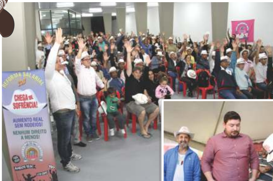
Comerciantes aprovam pauta de reivindicações durante Assembleia no SECOR

As mudanças previstas na Reforma Trabalhista já começam a aparecer: é o patrão inflexível e pensando apenas em seu próprio bolso! Mesmo assim, nos mantemos firmes nas negociações e trabalhando para conquistar o melhor para o comerciário!