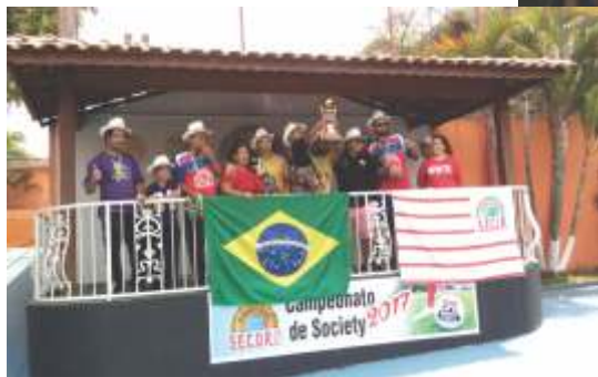
WALMART EMBU II

Em 24/9, realizamos a final do Campeonato de Society 2017! Entre as 32 equipes que participaram do Campeonato, a grande vencedora foi a Casas Bahia Carapicuíba, que levou o ouro para casa. Os comerciantes da Tok&Stok III ficaram em segundo lugar