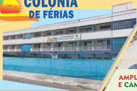
PRAIA GRANDE - SP