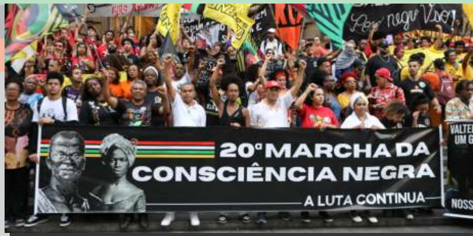
Estivemos, junto com a CUT e entidades na 20ª Marcha da Consciência Negra

Em celebração ao Dia da Consciência Negra, lembramos que, além de a partir deste ano, o feriado ser reconhecido como estadual, na quarta-feira, 29/11 a Câmara dos Deputados aprovou o projeto para que a data seja reconhecida como feriado nacional. Como já foi aprovado pelo Senado em 2021, o texto segue para sanção do presidente Lula. É conquista da nossa categoria o trabalhador que atue no dia do feriado ser assegurado a ele o recebimento de horas extras. Em caso de irregularidades, denuncie! Lembremos das lutas do povo negro e defendamos nossos direitos!