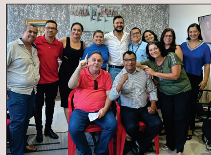
Reunião com secretária dos Direitos Humanos e advogados busca integrar esforços para desafios jurídicos